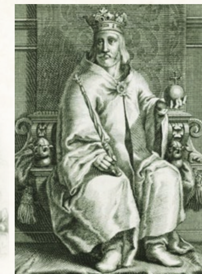
☞ Szapolyai János (I. János magyar király) a Mausoleum Potentissimorum Regum metszete alapján

IZABELLÁT HÚSZÉVESEN, KRAKKÓBAN JEGYEZTÉK EL JÁNOS KIRÁLY KÖVETEI, ÉS 1539. MÁRCIUS 2-ÁN HÁZASSÁGKÖTÉSE ALKALMÁVAL MEGKORONÁZTÁK.