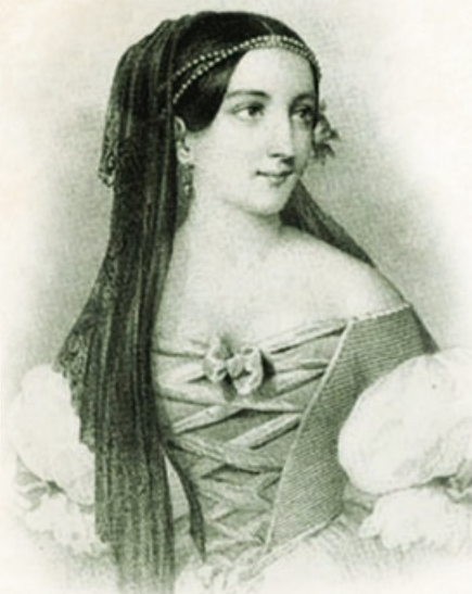
☞ Jagelló Izabella (1519–1559) Barabás Miklós 19. századi magyar festő litográfiáján

1539-ben a húszéves királyné egy Krakkóba küldött követség kérte feleségül a magyar trónon ülő, az ország keleti része felett hatalmat gyakorló, 52 éves Szapolyai János részére. A tárgyalások elrendezése után Izabellát díszes társaság, többek közt Perényi Péter koronaőr, Homonnai Drugeth István zempléni ispán és Brodaries István váci püspök kísérte a Magyar Királyságba. A leendő királyné februári érkezése után először Budán, a Várban pihent meg hosszabb időre – noha ez is csak pár nap volt. Március másodikán, heteken át tartó előkészületek és diplomáciai tárgyalások után már Székesfehérváron volt a király és leendő hitvese, ahol megesküdtek, majd Izabellát magyar királynévá koronázták. Az esküvő után Budára vonultak a lakodalmat megtartani, pompás ünnepségsorozat keretében. Itt a meghívott nemesek, valamint a városok küldöttjei mind átadták díszes ajándékaikat: aranyozott, drágaköves kupákat, ezüsthüvelyes szabályt, drágakövekkel ékesített bicskát, veretes lószerszámmal felnyergelt lovat, díszes szőnyeget. A pár tiszteletére, az ara reneszánsz műveltségének szellemében Istvánffy Pál történetíró az első magyar nyelvű széphistóriát írta nászajándékként, a Historia regis Voltert , vagyis Volter király históriáját, mely kifejezetten a főszereplő szerelmes pár női tagját, Grizeldiszt (és így szimbolikusan Izabellát) dicsőítette. Ez a mű egy Európa-szerte népszerű irodalmi hagyományhoz csatlakozva, minőség-