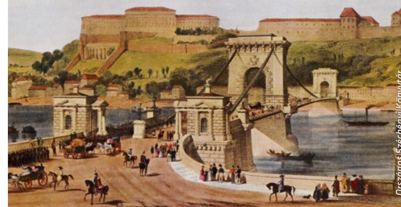
Országos Széchényi Könyvtár