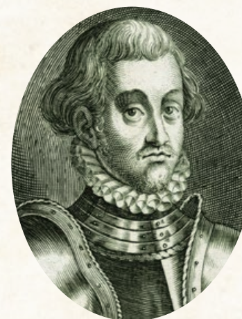
☞ Szapolyai János Zsigmond, II. János néven magyar király, az első erdélyi fejedelem

ben attól semmiben el nem maradva, igazán királyi ajándékot jelentett.