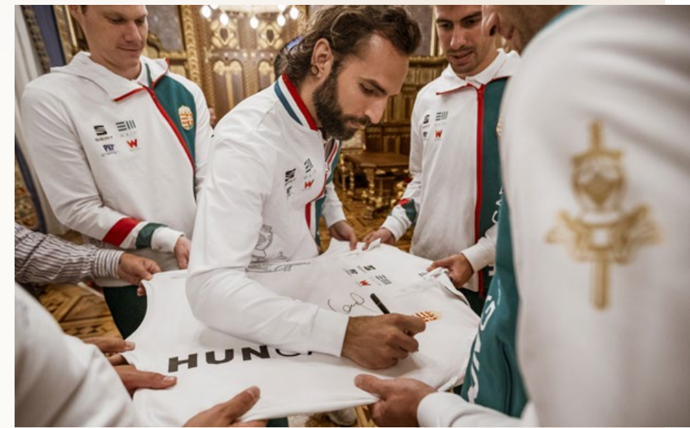
➤ A Szent István-teremben tett látogatásuk után a világbajnok sportolók aláírták az ajándékba hozott mezeket

mondta az ország egyik legnépszerűbb sportolója.