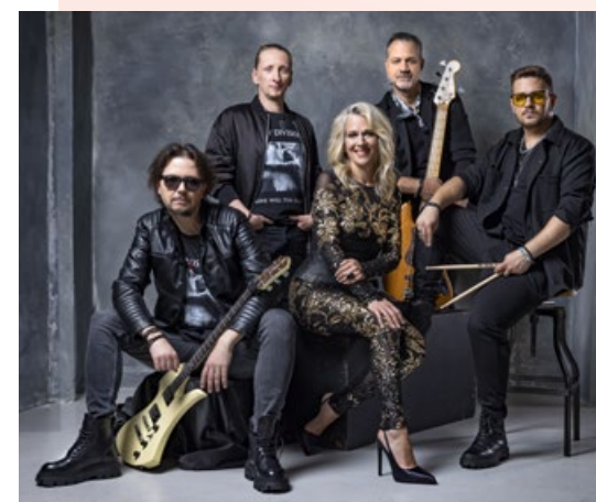
Wolf Kati Band