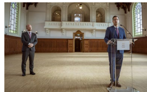
👉 Fodor Gergely és Gulyás Gergely a Lovarda és a Csikós udvar egyes elemeinek átadása alkalmából rendezett sajtóeseményen

lelegéansabb rendezvényközpontjának adhasson otthont. A felújításnak fontos része volt az is, hogy a terület akadálymentesen is megközelíthető legyen, így már a Tabán irányából is könnyen feljuthatnak az érdeklődők az újjászületett Csikós udvarra, két új, nagy kapacitású lift segítségével.