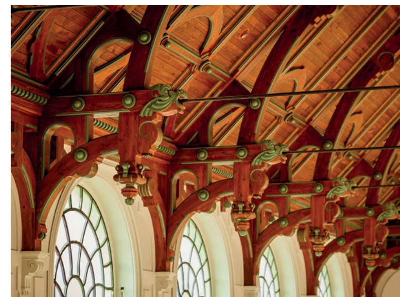
✂ A Lovarda külső és belső kialakítását aprólékosan kidolgozott, finom részletek jellemzik

A csodás épület a Kulturális Örökség Napjainak keretében megnyitotta kapuit a látogatók előtt. Mindenkit arra buzdítunk, nézze meg a századfordulós építészeti egyik remekművét, az anyagaiban és eljárásai-