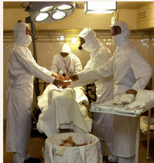
➤ Élethű viaszfigurák elevenítik meg a történelmet

Ezek a műszerek ma a Sziklakórházban berendezett állandó kiállítás részei, amelyek a hely különleges, fordulatokban gazdag történetét segítenek elmesélni, átélhetővé tenni. A negyvenes évek végén oltóanyagot gyártottak itt, majd az egész kórházat titkosították, ekkor kapták a LOSK 0101/1-es rejtjelszámot. Később a hidegháborús idők szellemében átalakították, hogy egy esetleges atom- vagy vegyi támadás után is legyen hol ellátni a betegeket, sérülteket a felszíni állapotoktól függetlenül. Mindezt annyira komolyan vették, hogy egészen a 80-as évekig a kijelölt személyzet tagjai gyakorlatokat is tartottak, hogy mindenki tisztában legyen a feladatával, és gondnokok tartották karban az épületet és a gépészeti rendszereket – mindezt szigorú titoktartási kötelezettség mellett. Az idő azonban végleg eljárt a