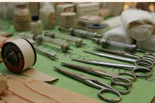
➤ Számos korabeli eszközt őriz a múzeum