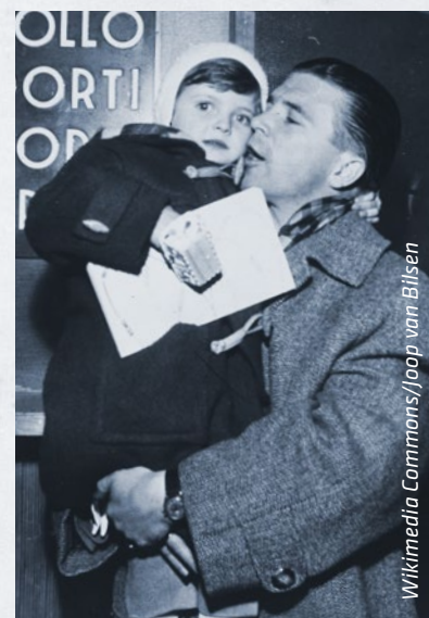
Wikimedia Commons/Joop van Bilsen