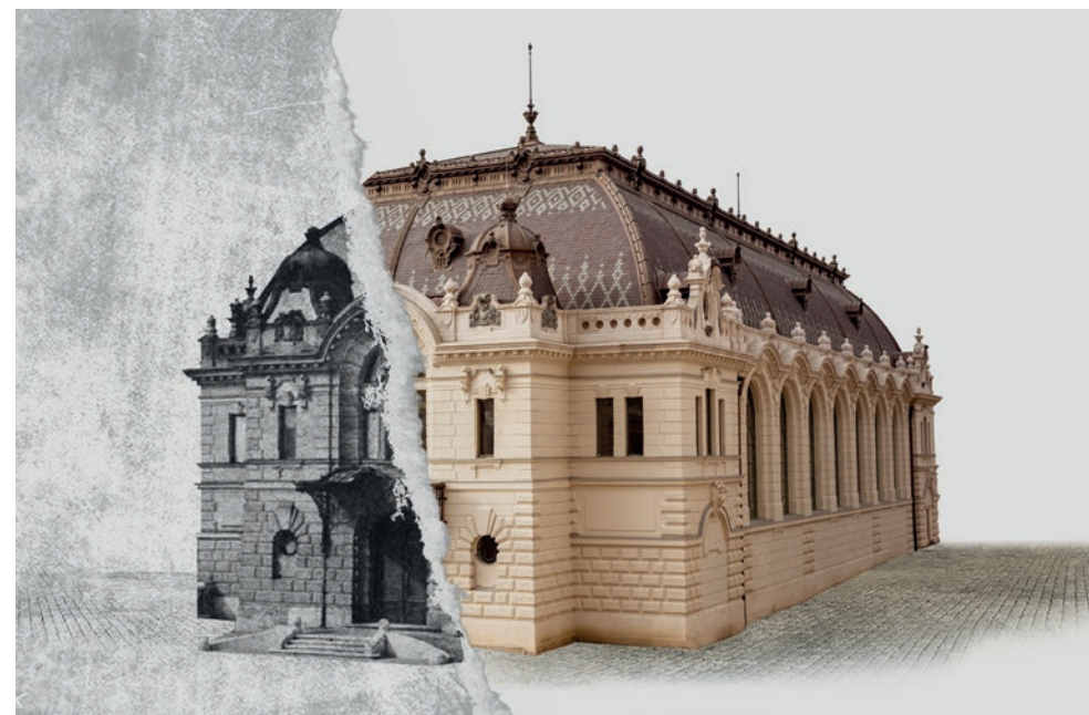
🗨 A Főörség és a déli összekötő szárny megújulását követően a Lovardával vált teljessé az a történelmi összhang, amely a Vár háború előtti arculatát meghatározta

✿ Építészként már eddig is gazdag életmű áll ön mögött. Engem azonban most a kezdetek érdekelnek. Például az, hogy a BME építész szaka után miért tartotta fontosnak, hogy ELTE művészettörténet szakát is elvégezze?