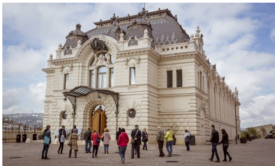
👉 A Csikós udvar ifj. Vastagh György Lovát fékező csikós nevű szobráról kapta a nevét

A palotaudvar és a Csikós udvar összeköttetésének koncepciója a 19. és 20. század fordulóján született meg, Hauszmann Alajosnak köszönhetően. A Várba való feljutás megkönnyítésére 1900 körül alakították ki a Palota útról a Csikós udvarba, onnan pedig a Hunyadi udvarba felvezető rámparendszert. Önálló, ugyanakkor a palotával kapcsolatban álló gazdag épületegyüttes jött itt létre: az alsó teraszon 1901-től a