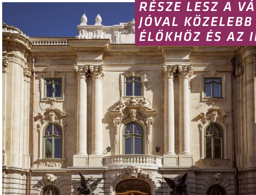
✿ A Budavári Palota déli összekötő szárnyának rekonstrukciója volt az első lépés a teljes palotaépület újjászületéséhez