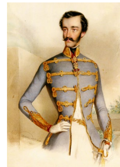
✂ Habsburg-Lotaringiai István Ferenc Viktor főherceget a Magyar Országgyűlés 1847. november 12-én választotta nádorrá

A Nemzeti Hauszmann Program keretében újjászületett, közel 1500 négyzetméteres Lovarda rekonstrukciójának célja nem kevesebb volt,