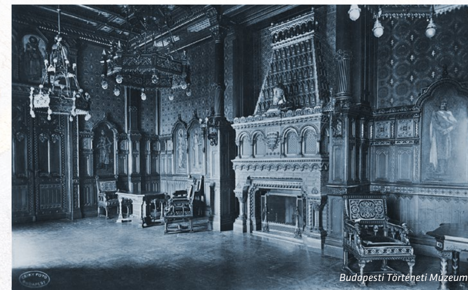
Budapesti Történelmi Múzeum

✂ „A tervező-építész legfőbb gondjai közé tartozik, hogy ki fogja tervét végrehajtani. Nekem e tekintetben nem kellett aggódnom, mert oly férfiakat hívtam föl a közreműködésre, a kikben már előre is meg volt a biztosítéka annak, hogy csak jót, csak kiváló alkotnak” – írta Hauszmann Alajos a csodálatos együttműködésről.