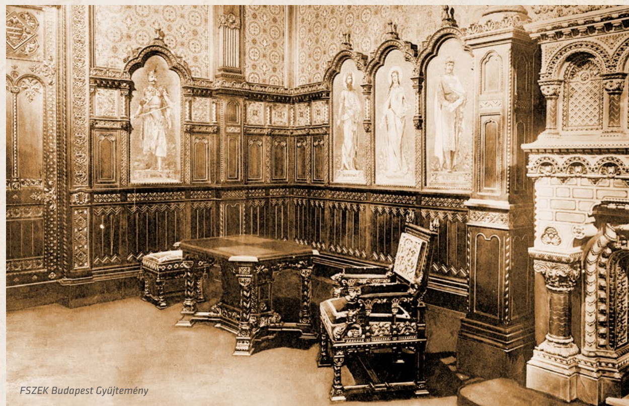
FSZEK Budapest Gyűjtemény

A Nemzeti Hauszmann Program keretein belül számos szakértő és iparművész évek óta dolgozik azon, hogy a legapróbb részletekig hűen újra megalkossák ezt a csodálatos helyiséget, amely 2021. augusztus 20-án végre megnyithatja kapuit a nagyközönség számára, az első napokban ingyenesen. ✂