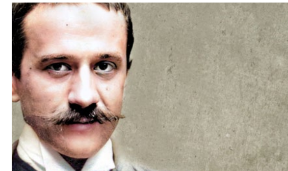
IFJ. VASTAGH GYÖRGY