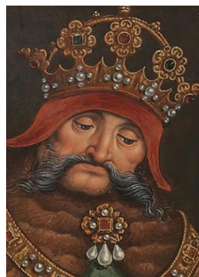
✂ III. András 1290 és 1301 között uralkodott Magyarországon. Apja István herceg, II. András király utószülött fia volt

Ebben a templomban került sor III. András temetésére. Bár a sír az utódoktól nem kapott különösebb tiszteletet, a kolostor később országos hírvé lett. A 14-15. század fordulóján, amikor felépült Buda városának déli végén az új királyi palota, majd Zsigmond korában ez vált az ország fő királyi rezidenciájává, a közelében álló rendház a ferencesek egyik legfontosabb magyarországi kolostorává lett. Mátyás király idejében a kolostorban működő rendi főiskolán tanított a nagy hírvé Temesvári Pelbárt is. 1526-ban, amikor a törökök a mohácsi csata után lerohanták, majd elhagyták