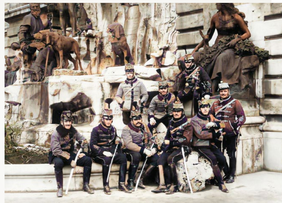
☛ Első világháborús huszárok a néhány évvel korábban elkészült Mátyás kútjánál. Strobl maga is behívót kapott, részt is vett a harcokban, kötelességtudatból és hazaszeretetből, családjá és a művésztszádalom tiltakozása ellenére. Összesen 14 véres ütközetben harcolt, s végül súlyosabb sérülések nélkül, épségben tért haza. Bajtársairól számtalan rajzot készített

Akkoriban nem volt ritka, hogy egy művészi ambíciókkal útjára indu-