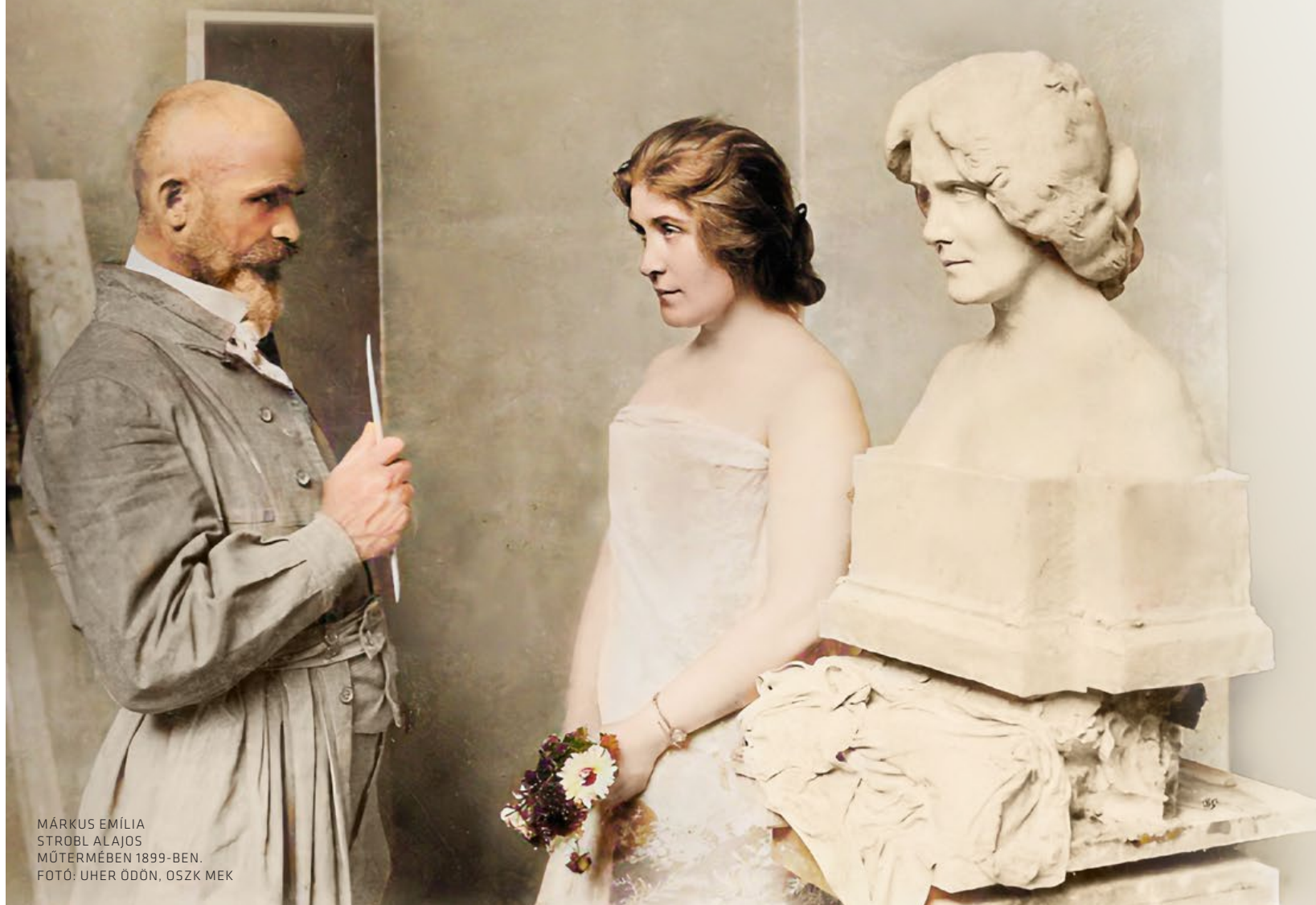
MÁRKUS EMÍLIA STROBL ALAJOS MŰTERMÉBEN 1899-BEN.

Egy gyermekszívű zseni, az utolsó romantikus művész-lovag, gránit-óriás, miközben lelkes művész és ember is: mondták róla kortársai, családtagjai. Olyan ember volt, aki irtózott minden prózáitól és kisszerűtől, akit élete minden percében az alkotás- és tettvágy, a világ átformálásának, jobbá tételének szenvedélye fűtött.