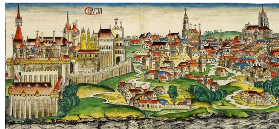
✂ A Schedel-féle világkrónika egyik illusztrációján is látható a Szent János ferences templom támpilléres, tornyos épülete, amely a kép jobb szélén helyezkedik el