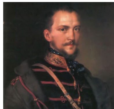
✂ Görgei Artúr a magyar hadtörténet kimagasló személyisége, érdemeit a világosi fegyverletétel miatt sokan sajnós máig tévesen és egyoldalúan ítélik meg

dót kellett kialakítani (a Vörös Sün 1805-ben szálláshelyként be is zárt).